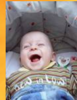
Rechts wird gelacht

Es ist wichtig ein Netz aufzubauen, das das vorhandene Wissen auffängt und Möglichkeiten zur Verknüpfung bietet. Jedes einzelne Kind sollte die Förderung erhalten, die den aktuellen emotionalen, sozialen und leistungsmäßigen Bedürfnissen entspricht.